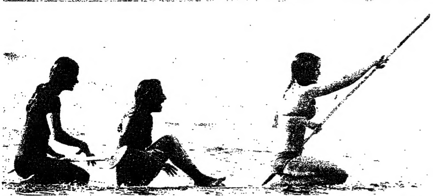
السباحة من هواية عالية